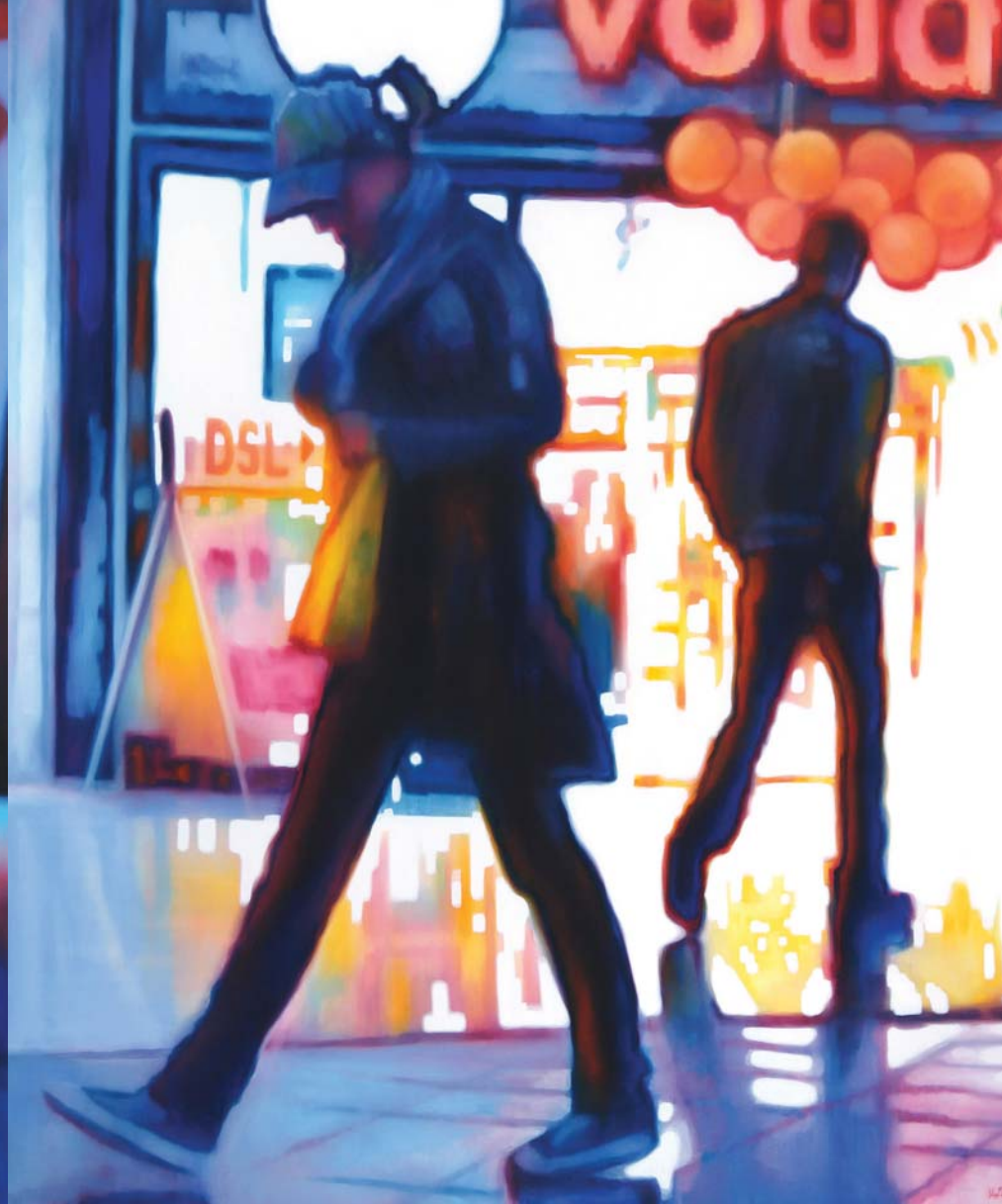
ARB802 Óleo sobre tela. 2008. 180 x 150 cm.