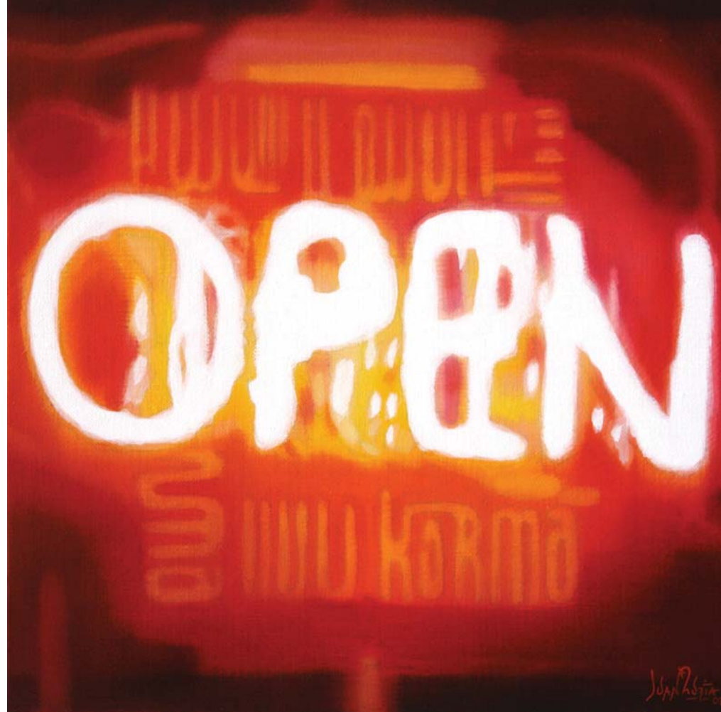
ARB805 Óleo sobre tela. 2008. 25 x 25 cm.

I think the work as a whole gives a sense of virtual transportation, playing with the elements of the present reality like matter - his paintings- taking us to the anonymous no-place in the space of the city, with anonymous passers-by in movement or, if you discover the boulevards of Paris registered digitally and painted by the artist/transgressor Juan Zurita in 2008.