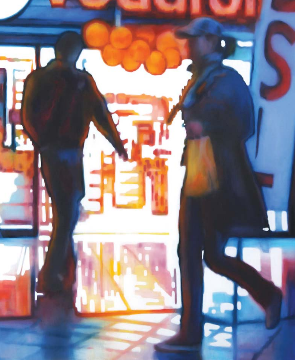
ARB804 Óleo sobre tela. 2008. 180 x 150 cm.