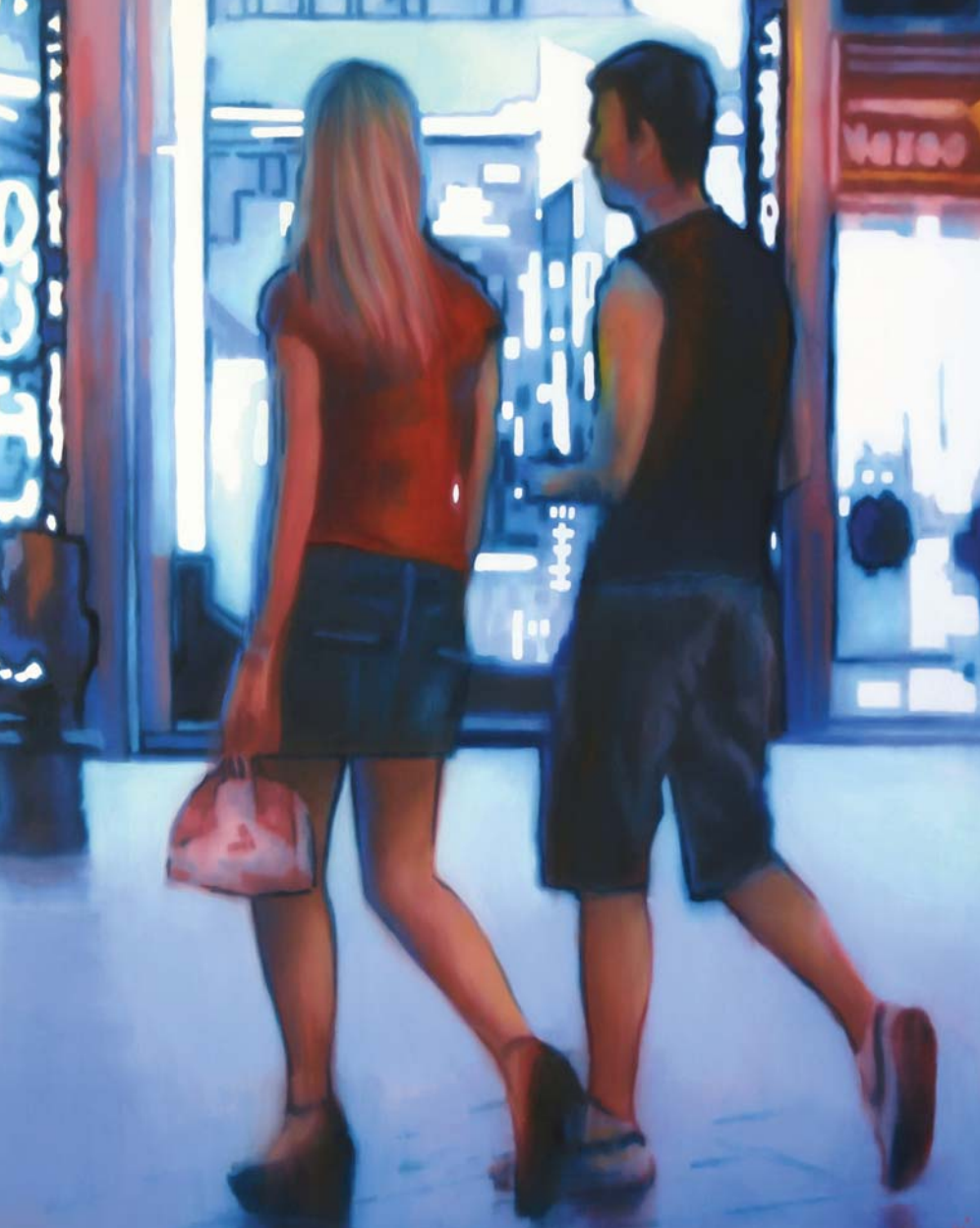
EAZ804 Óleo sobre tela. 2008. 162 x 130 cm.